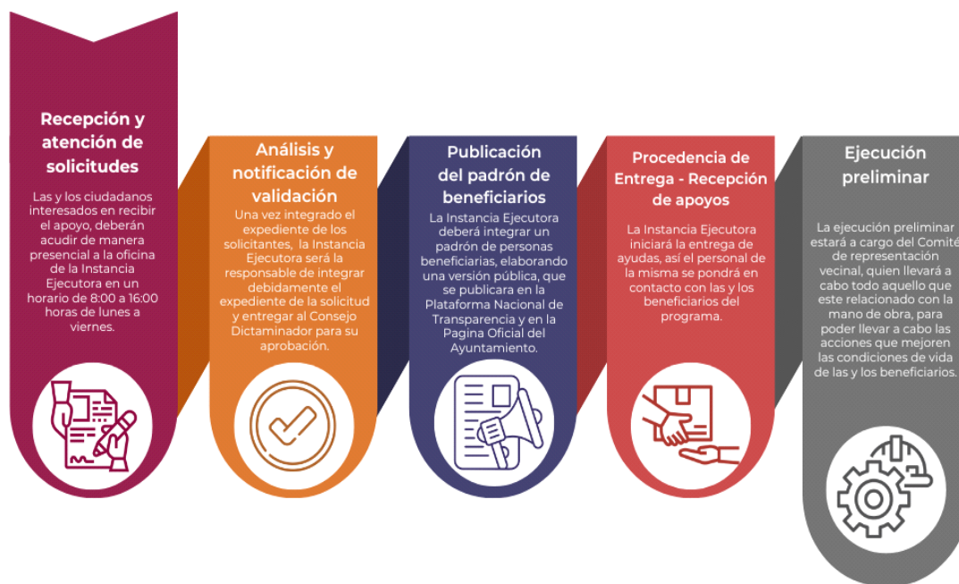
DIAGRAMA II. PROCESO DE EJECUCIÓN

La ejecución preliminar estará a cargo del Comité de Representación Vecinal, quien llevará a cabo los trabajos de limpia y todo aquello que esté relacionado con la mano de obra para poder llevar a cabo las acciones que mejoren las condiciones de vida de las y los beneficiarios.