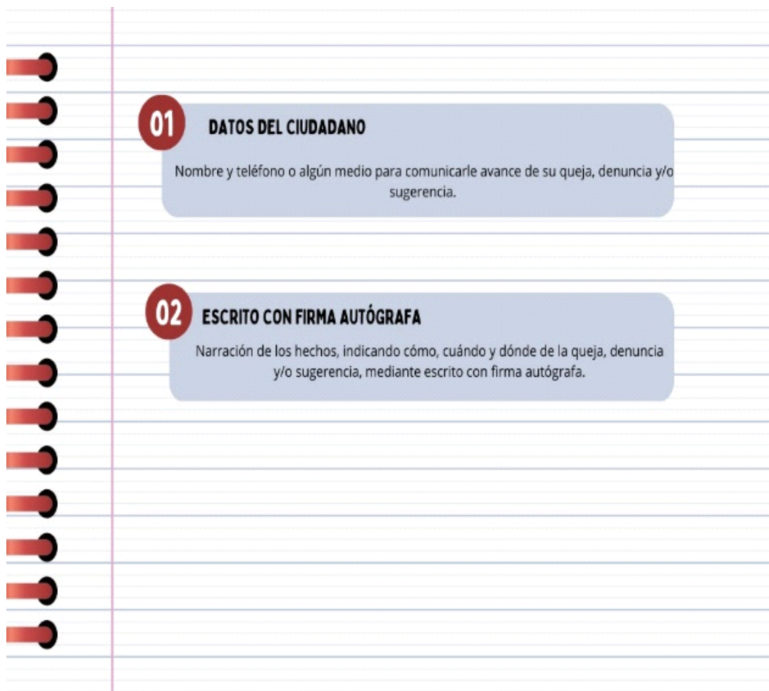
Diagrama IV. Requisitos

Toda queja, denuncia y/o sugerencia deberá contener: