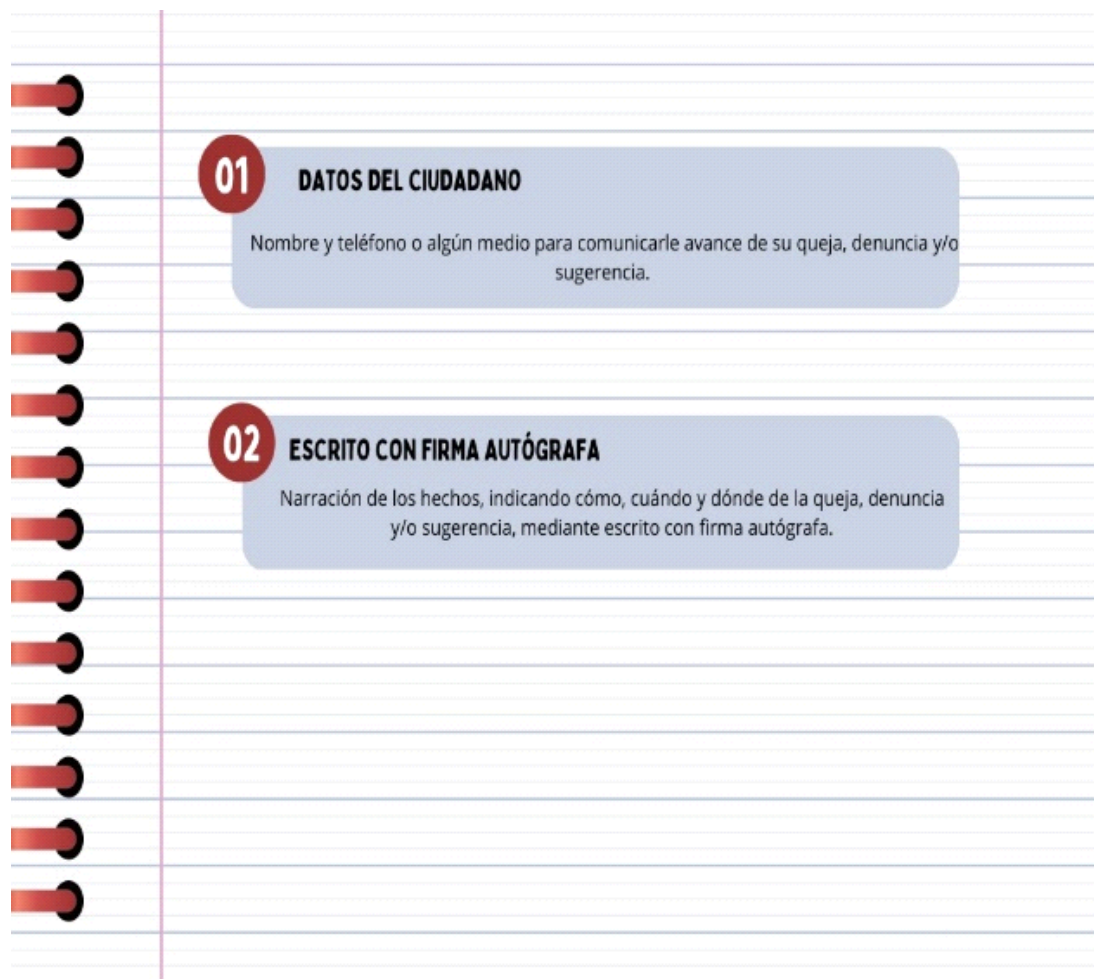
Diagrama IV. Requisitos

Toda queja, denuncia y/o sugerencia deberá contener: