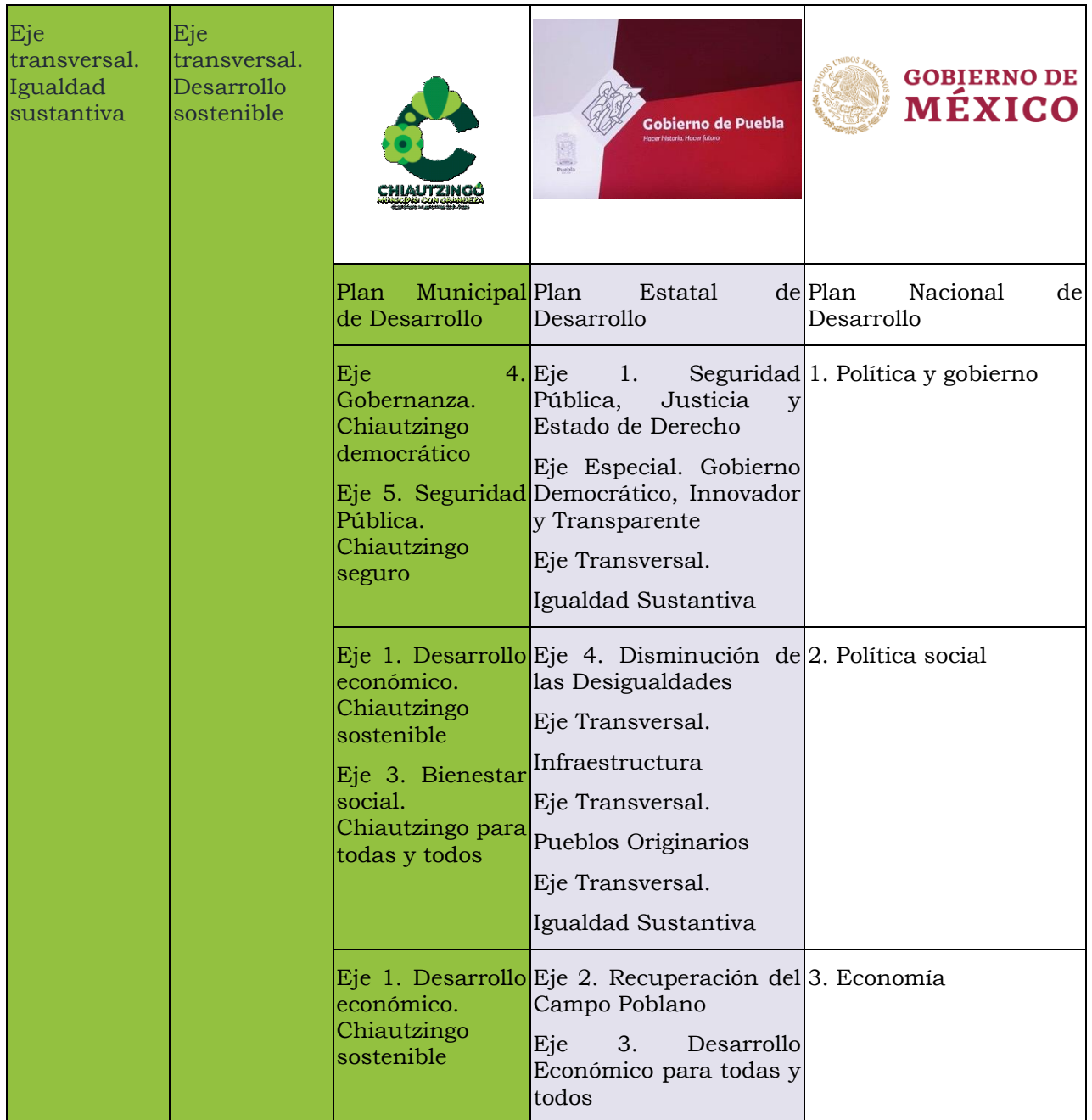
Tabla 11. Alineación del PMD

Vinculación de los Ejes Estratégicos del Plan Municipal de Desarrollo (PMD) 2021-2024 del H. Ayuntamiento de Chiautzingo con los Ejes Estratégicos y Transversales del Plan Estatal de Desarrollo 2019-2024 y del Plan Nacional de Desarrollo 2019-2024.